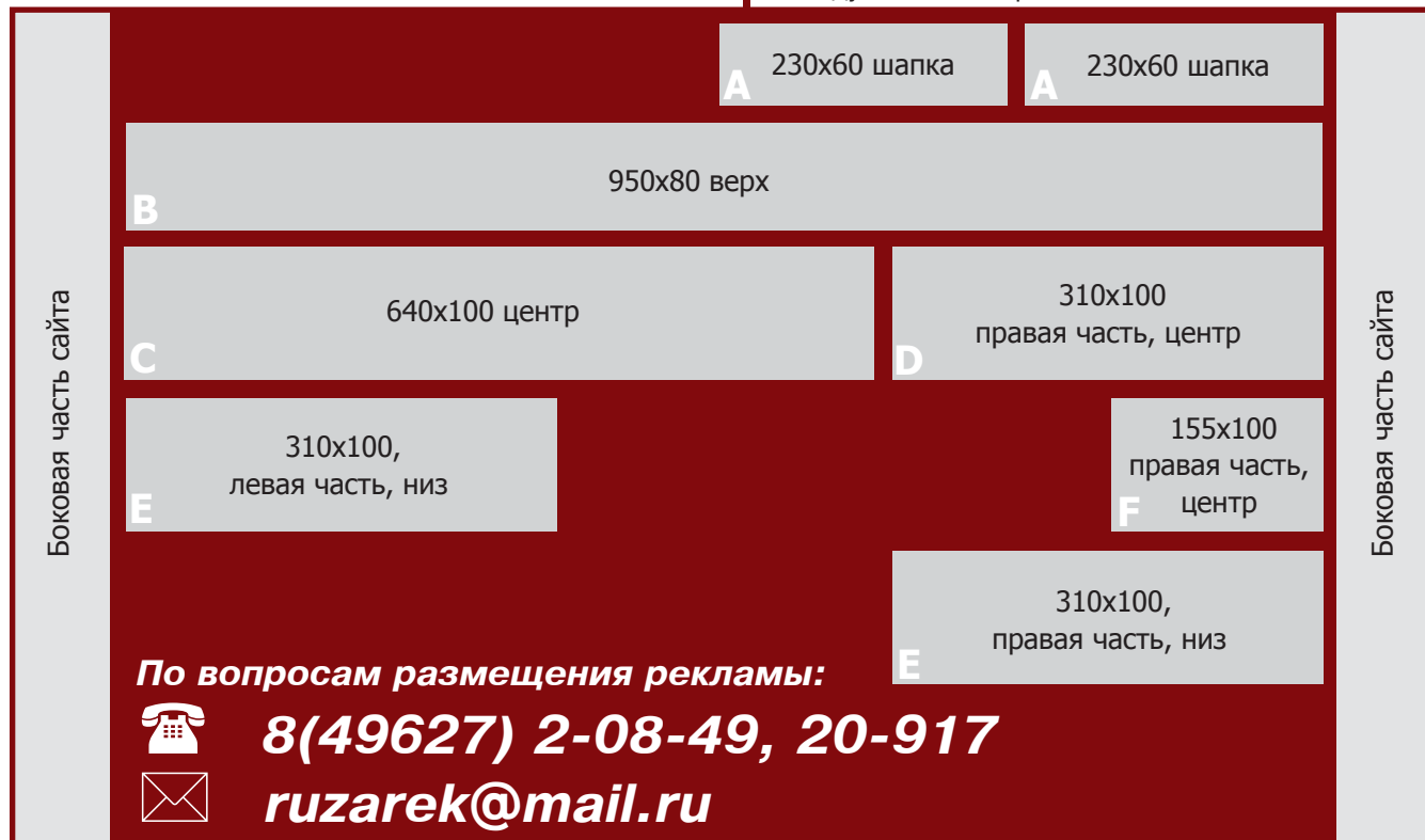
Модульная сетка рекламы на сайте kz-ruza.ru