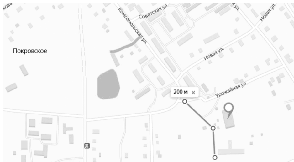
Схема расположения автомобильной дороги общего пользования местного значения, расположенных по адресу: Московская область, Рузский район, д. Высоково

Схема расположения автомобильной дороги общего пользования местного значения, расположенных по адресу: Московская область, Рузский район, с. Покровское, ул. Комсомольская, к школе и ФОК, к земельным участкам 50:19:0030302:728, 50:19:0030302:760, 50:19:0030302:131, 50:19:0030302:107, 50:19:0030302:128