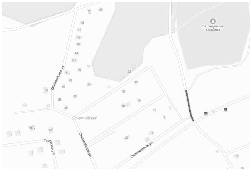
Схема расположения автомобильной дороги общего пользования местного значения, расположенных по адресу: Московская область, Рузский район, от начала до конца п. Старо

Схема расположения автомобильной дороги общего пользования местного значения, расположенных по адресу: Московская область, Рузский район, д. Петрищево, проезд к кладбищу