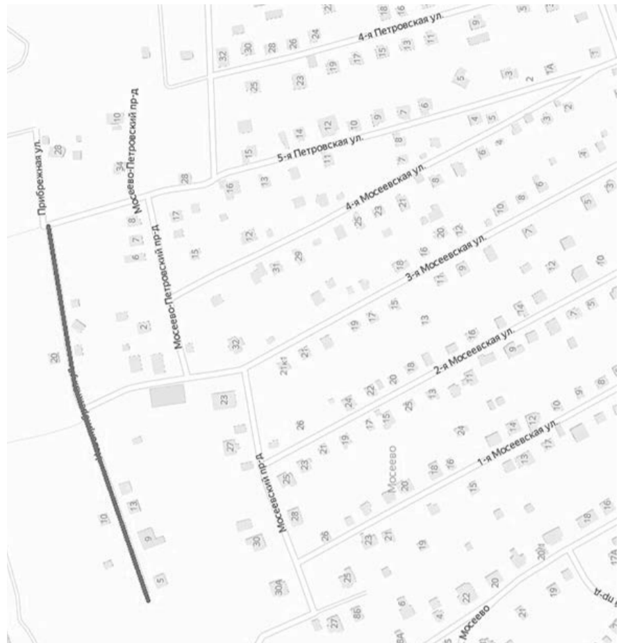
Схема расположения автомобильной дороги общего пользования местного значения, расположенных по адресу: Московская область, Рузский район, рп. Тучково, Мосеево-Петровский проезд